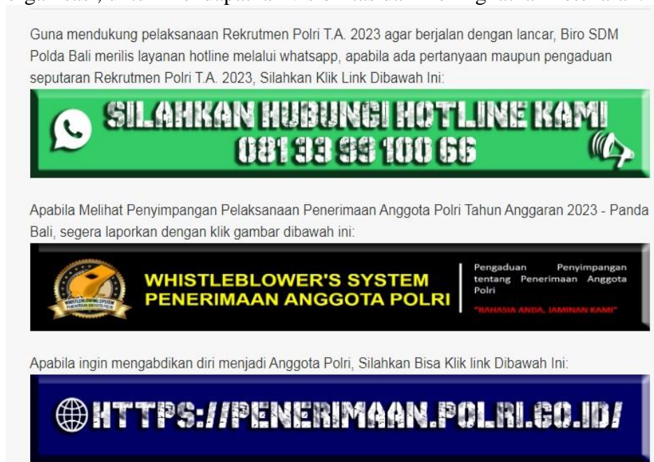
Gambar 4.3. Tangkap Layar Di Beranda Website Polda Bali Terkait Pengumuman Rekrutmen Proaktif

Hasil tersebut menerangkan bahwapada pelaksanaan rekrutmen proaktif dilakukan pengumuman dan penyebaran informasi yang intensif baik melalui sosialisasi ke sekolah-sekolah, melibatkan pihak jurnalis maupun aktif menyebarkan informasi melalui media sosial dan situs resmi Polri. Cara ini merupakan upaya aktif Polri untuk menarik calon anggota yang merupakan generasi digital. Sebagaimana ditegaskan penelitian tedahulu bahwa pemberi kerja saat ini sangat akrab dengan praktik perekrutan di jejaring sosial online, terutama Facebook. Facebook dipandang sebagai sumber informasi penting, lebih tepatnya untuk mempromosikan perusahaan, untuk menampilkan ciri-ciri budaya organisasi, untuk mendapatkan visibilitas dan meningkatkan ketenaran. 32