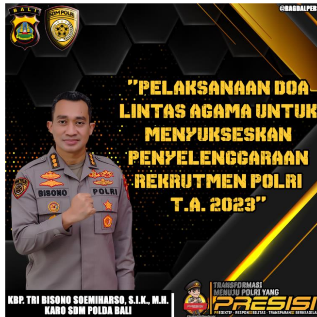
Gambar 4.4. Pamflet Acara Doa Lintas Agama 34

Upaya menarik minat ini merupakan konsep Inbound Recruiting , yakni sebuah metode untuk membuat konten perekrutan yang ditargetkan dan bermerek dengan tujuan menarik bakat-bakat yang ada di masyarakat. Rekrutmen proaktif sendiri merupakan branding yang dilakukan Polri untuk menarik bakat-bakat yang ada di daerah khususnya di pulau-pulau terpencil dan terluar di seluruh Indonesia. Adapun cara yang dilakukan adalah: